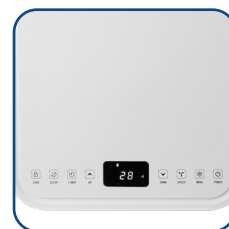
Pannello comandi touch con display a LED Touch control panel with LED display