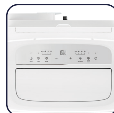
Pannello comandi digitale e display a LED Digital control panel and LED display