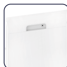
Pratiche maniglie laterali Useful side handles