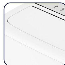
Flap superiore motorizzato, con ampia oscillazione automatica o posizione fissa Top motorized flap with wide automatic swinging, with automatic swing or fixed position